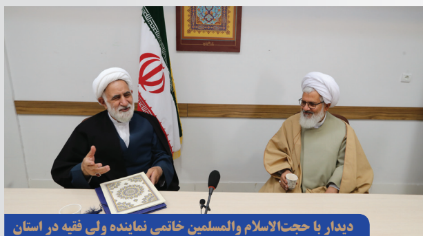
دیدار با حجت الاسلام والمسلمین خاتمی نماینده ولی فقیه در استان