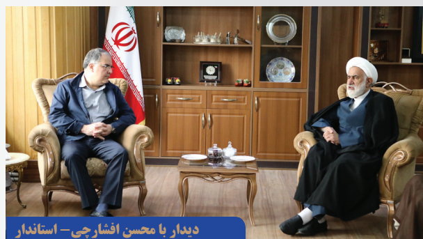
دیدار با محسن افشارچی - استاندار