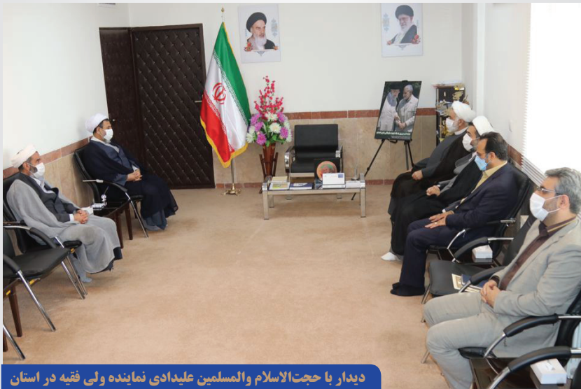
دیدار با حجت‌الاسلام والمسلمین علی‌دادی نماینده ولی فقیه در استان

دیدار با حجت‌الاسلام والمسلمین علی‌دادی نماینده ولی فقیه در استان دیدار با آقای علی زینی‌وند استاندار