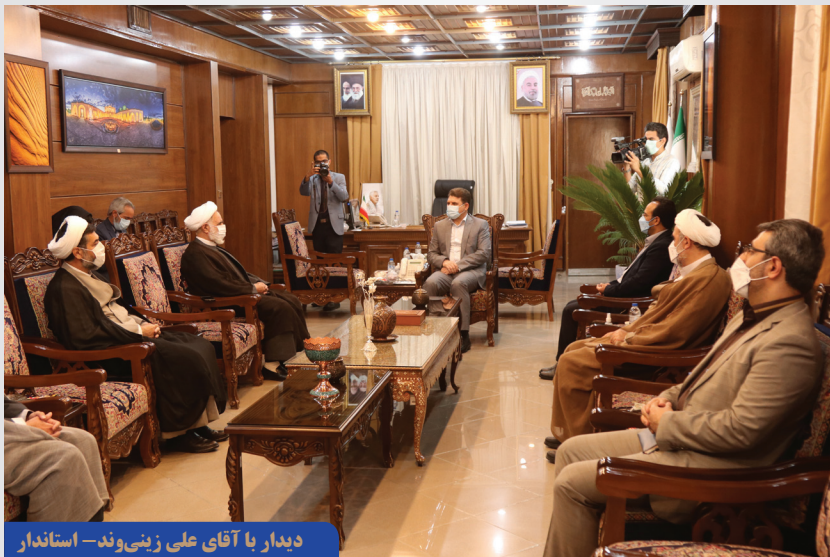
دیدار با آقای علی زینی‌وند - استاندار