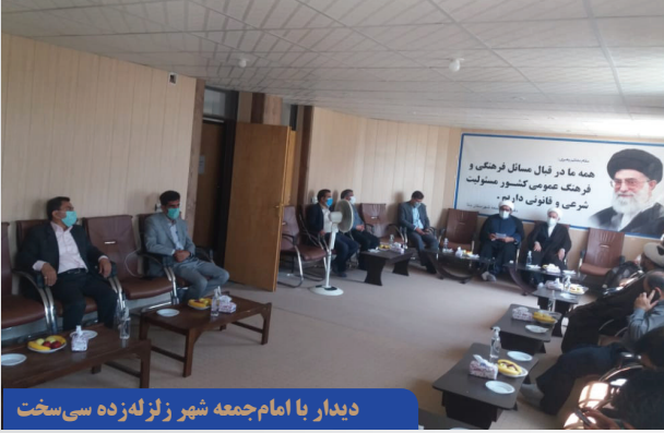
دیدار با امام جمعه شهر زلزله زده سی سخت