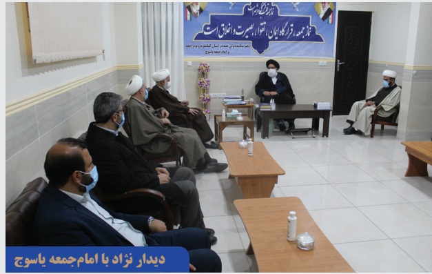
دیدار نژاد با امام جمعه یاسوج